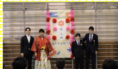
クラスごとに記念撮影