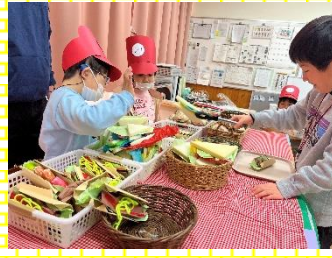
お店屋さんごっこ